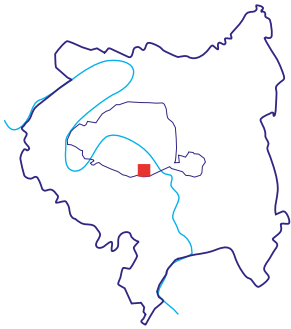
Site «Inventons la Métropole du Grand Paris», ZAC Paul Bourget